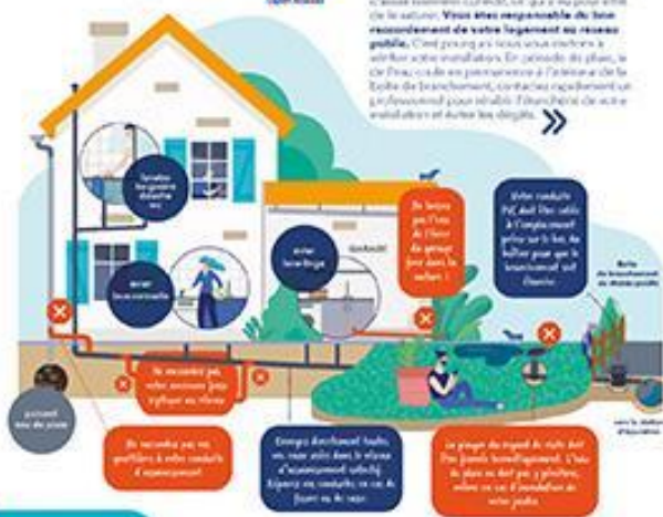
Les équipements doivent être correctement installés et bien entretenus.

« De nombreuses plaintes se sont accumulées au sein du département au cours de l'automne-hiver 2019-2020. Cette situation, pour être prise en compte, a nécessité des délais de raccordement chez des particuliers. Toutefois, certains secteurs, tels que principalement l'agglomération d'Épône, de Jûvis, dans le secteur d'assainissement d'Épône, ne que n'ont pu être traités de la sorte. Vous êtes responsable de leur raccordement de votre logement au réseau public. Ceci pousse à tous vos efforts à vérifier votre installation. En cas de doute, le DEPE ou de ses partenaires à l'initiative de la Ecole de Branchement, contactez rapidement un professionnel pour établir l'itinéraire de votre installation et éviter les dégâts. »