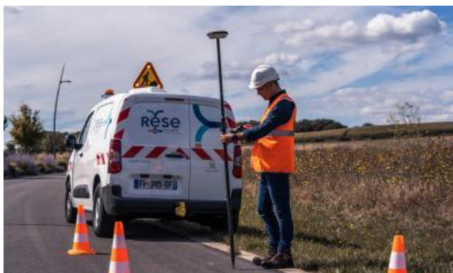
Cartographie des réseaux ©16/9E, SIMON BLUTEAU