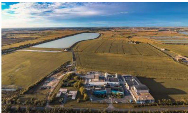
Production d'eau potable

La RESE produit 35 millions de m 3 d'eau potable par an (chiffres 2023). En Charente-Maritime, l'eau potable fournie au robinet est soit puisée dans le sous-sol, soit pompée dans le fleuve Charente, parfois les deux. Pour produire cette eau, la RESE gère 49 forages et 5 unités de production. La plus importante du département est l'usine Lucien Grand à Saint-Hippolyte.