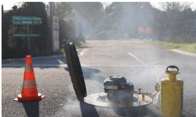
Contrôle à la fumée

La RESE étudie les demandes d'intervention des entreprises de réseaux et de travaux publics d'intervention à proximité des réseaux d'eau.