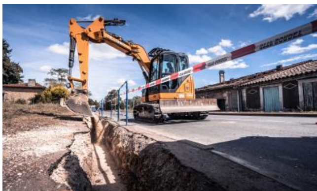
Travaux sur réseaux publics d'eau potable et d'assainissement collectif

La RESE réalise des extensions de réseaux et des travaux d'amélioration des infrastructures pour Eau 17.