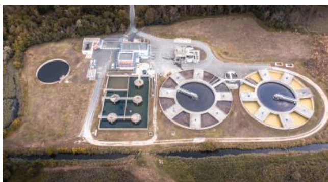
Traitement des eaux usées

La RESE collecte et épure les eaux usées sur 186 communes avant de les restituer au milieu naturel.