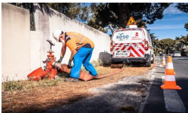
Vérification des points de défense extérieure contre l'incendie

À la demande des communes, la RESE réalise des études hydrauliques préalables à la pose de points de défense extérieure contre l'incendie. Elle peut également assurer la pose, l'entretien et le contrôle de ces points d'eau. Enfin elle peut intervenir dans la création et la mise à jour de schémas communaux DECI.